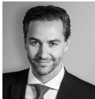
Mag. Johannes Klaus Wiener Börse AG