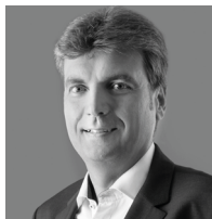
Thomas Dietrich Raiffeisen Centrobank AG